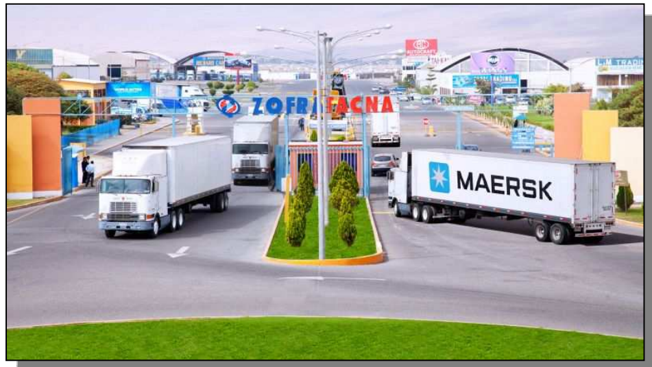
Ingreso al Complejo ZOFRATACNA

El Complejo de la ZOFRATACNA, cuenta con un CERCO PERIMETRICO de una altura promedio de 2.80 metros, el mismo que abarca las 180 hectáreas habilitadas.