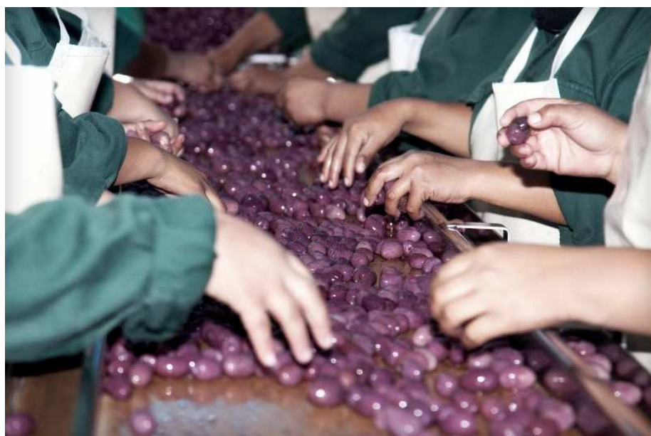
Actividad Agro industrial