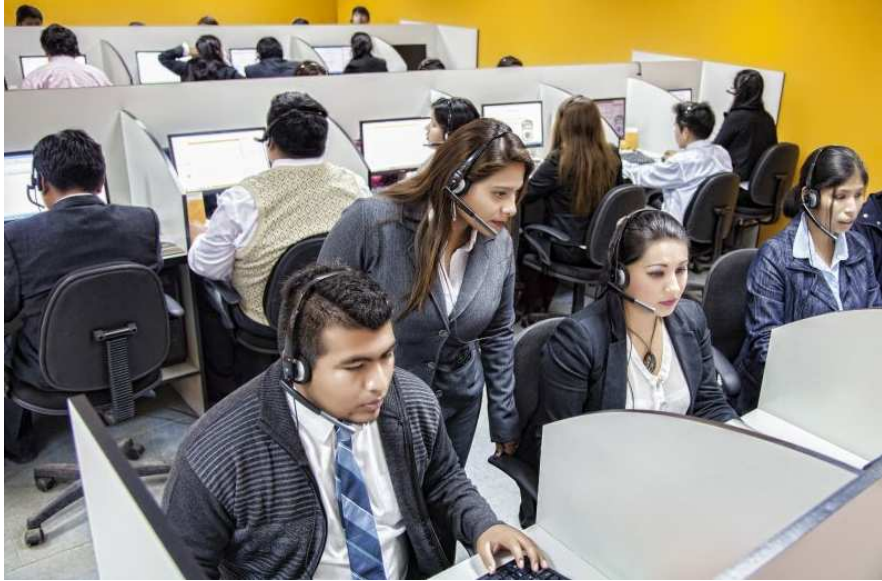
Actividad Call Center