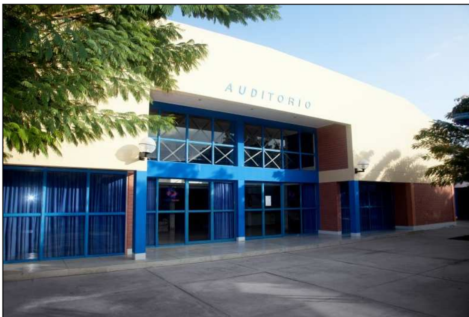
Auditorio - ZOFRATACNA