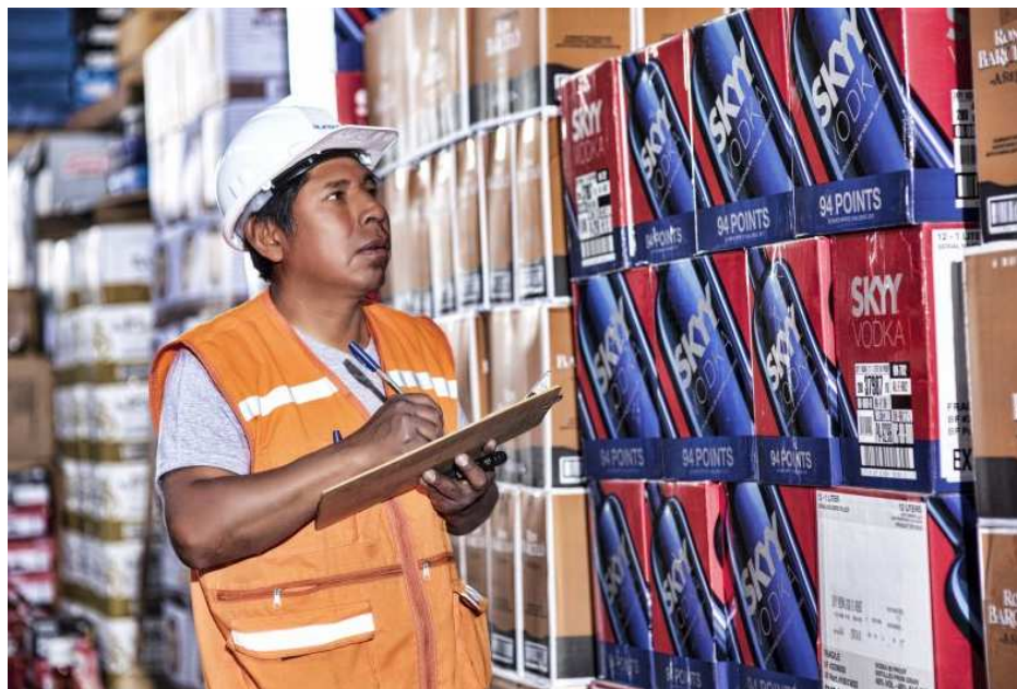
Actividad de almacenamiento